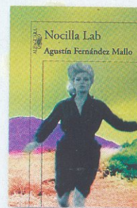
Nocilla Lab Agustín Fdez. Mallo Alfaguara

go tan sencillo como narrar sin el prejuicio de creer que estoy narrando, narrar de la manera en que realmente vivo mi vida del día a día”.